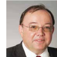
Roland Schmid Regionalrat, Jurist, Ministerialrat und ehemaliger Landtagsabgeordneter